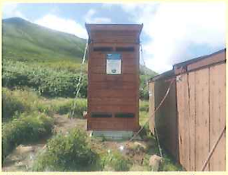
美瑛富士避難小屋の携帯トイレブース

携帯トイレを使うときに身を隠す場所として、設置されているところがあります。テント型と固定型があります。 便座がありますので、携帯トイレをきちんとセットして使用しましょう。あとの人のためにも、ブースはきれいに使いましょう。