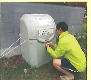
白金温泉の携帯トイレ回収BOX

使用した携帯トイレは、自宅まで持ち帰り、自治体のルールにしたがって処分しましょう。